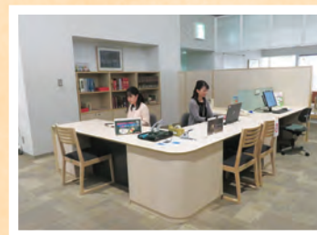
▲3階サブカウンター