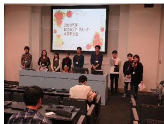
↑昨年度の様子です！ 多くの方に来場していただきました♪